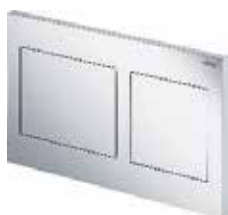
Visign for Style 21 bedieningspaneel