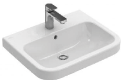
Villeroy & Boch Architectura wastafel 600 Wit (exclusief kraan)