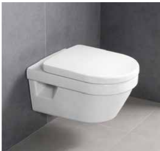
Villeroy & Boch Architectura wandcloset direct-flush/rimfree combi-pack