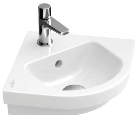
Villeroy & Boch Subway 2.0 hoekfontein 320x320