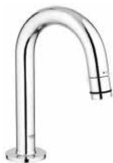
Grohe Universal fonteinkraan