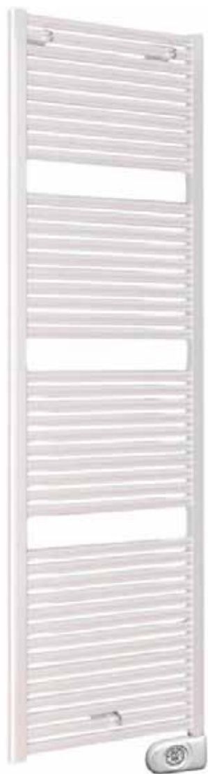
Claudia elektrische decorradiator 1807x600 RAL9016 Wit