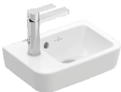
Villeroy & Boch O.novo 2.0 fontein L/R 360x250 (exclusief kraan)