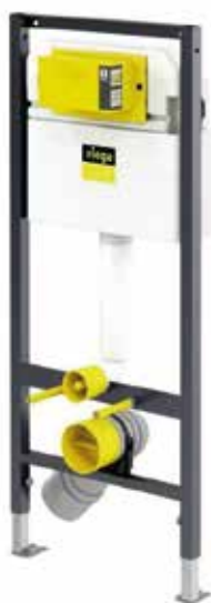
Viega Prevista WC-element 1130