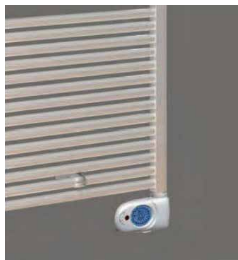
DRL E-Comfort Claudia elektrische digitale thermostaat