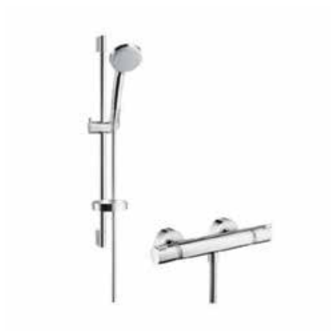
Hansgrohe Croma variojet doucheset 650