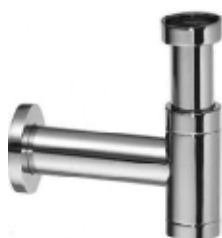
Raminex designsifon Slim met muurbuis