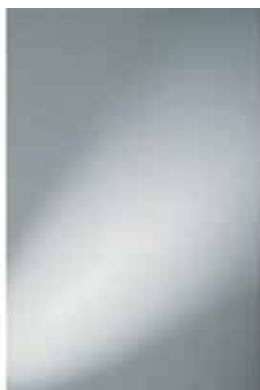
Spiegel 600x800 met verborgen ophanging